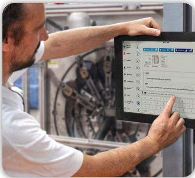
Daten direkt am Terminal erfassen

„Selber machen“ ist Programm: Probieren Sie selbst die Möglichkeiten der digitalen Fabrik unter realen Bedingungen aus - direkt an den Maschinen an verschiedenen Stationen: