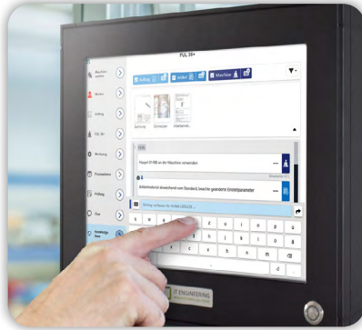
Wichtige Informationen überall digital abrufen