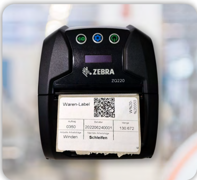
Warenbegleitschein direkt vom Terminal ausdrucken